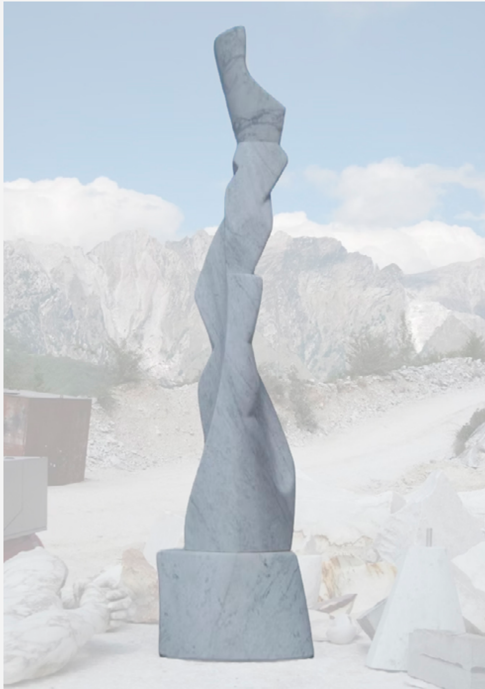
The teller — marbre Carrare h. 200 cm