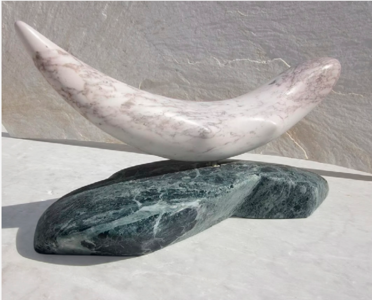
Prisca — marbre Carrare marbre vert des Alpes 55x26x20 cm Galerie Art forum