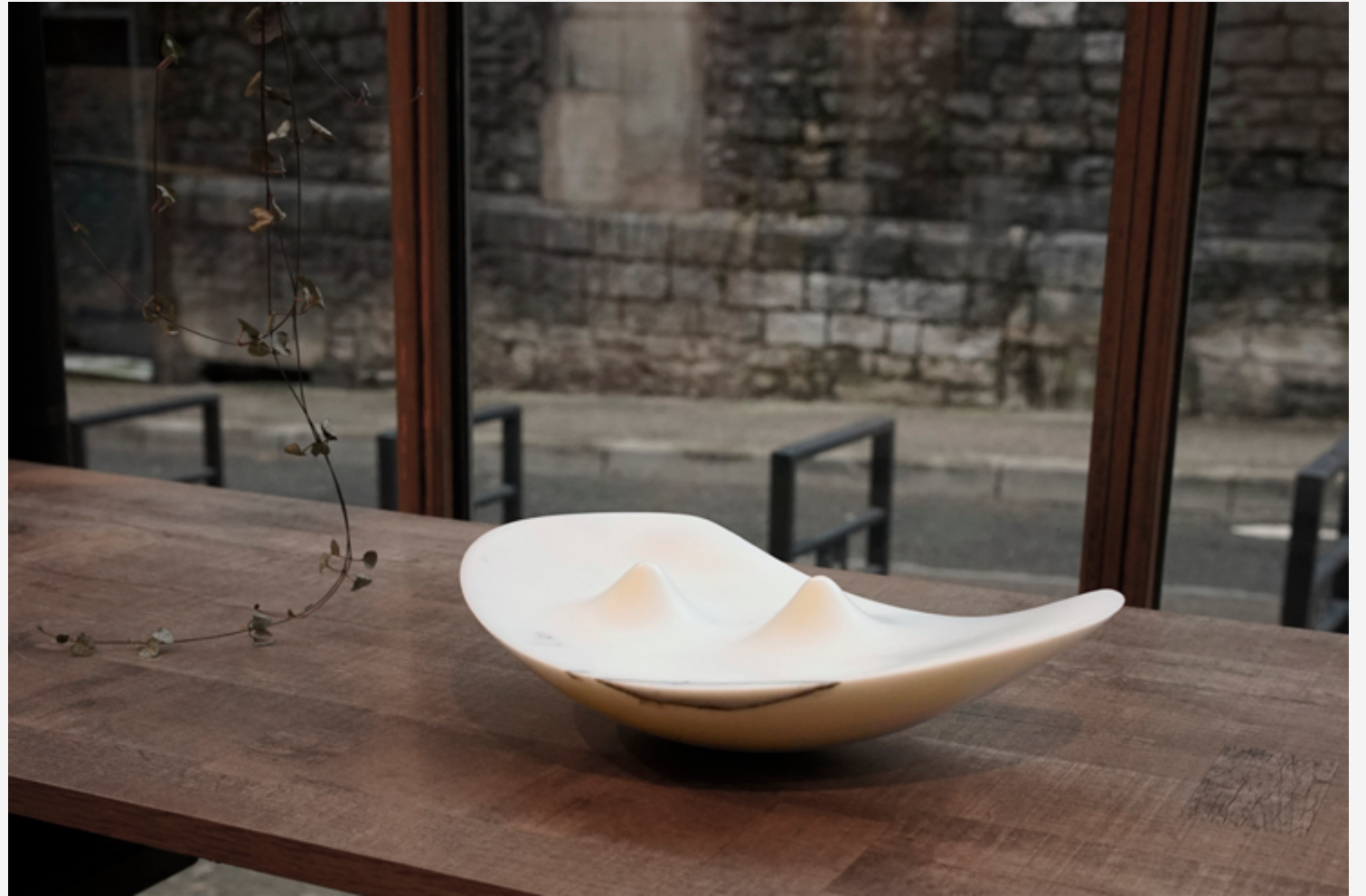
Pia — marbre Carrare l. 30 cm Cinétique