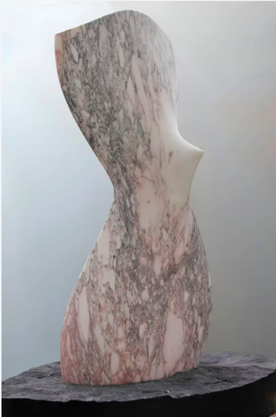
Blanche épine — marbre Carrare marbre noir belge 60 x 50 x 25 cm