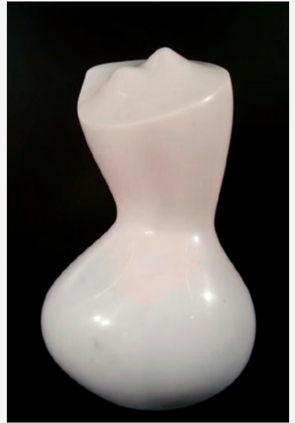
Lucy — marbre Carrare h. 72 cm