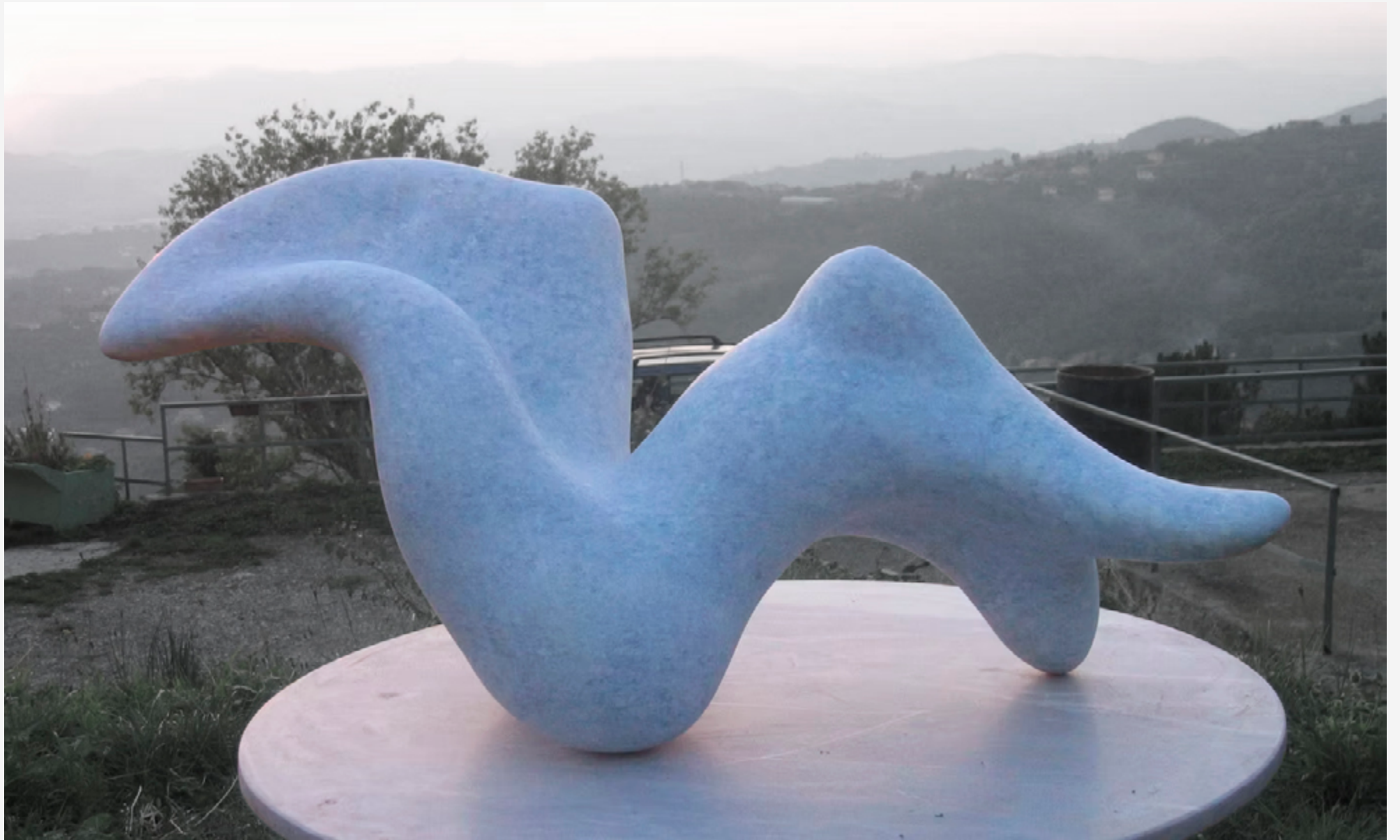
Selena — Quartzite Angola l. 90 cm